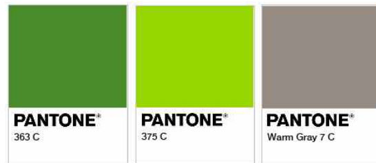
그림 E.3 녹색경영시스템 인증제도 마크의 표시 형태와 색상 Figure E.3 Reproduction of the GMS scheme mark and colors