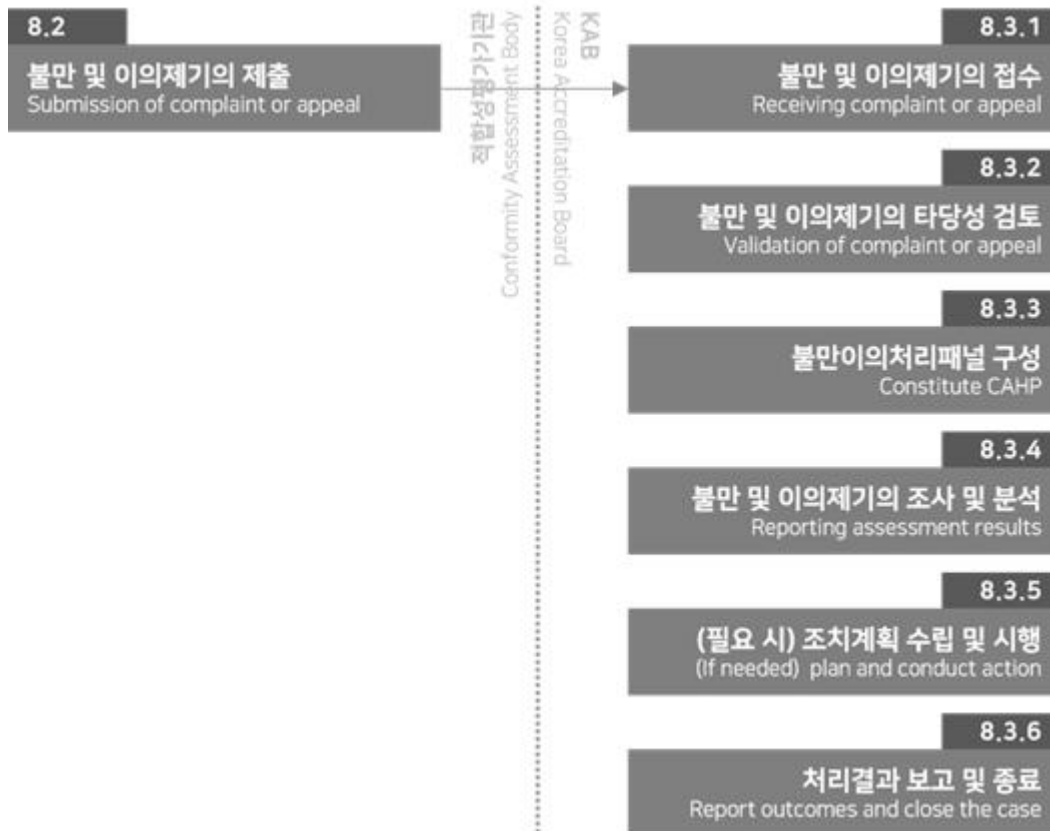
그림 8.1 KAB 불만 및 이의제기 처리절차 개요도