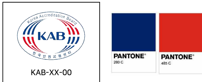
그림 E.1 KAB 인정마크의 표시 형태와 색상

KAB 인정마크는 KAB의 로고 아래에, 표 E.1 에 명시된 인정스킴 기호(XX)와 인정서에 표기된 고유인정번호(00)를 조합한 KAB-XX-00의 문구를 포함하여, 그림 E.1 과 같이 표기하여야 합니다.